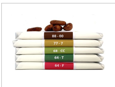
Rrraw 04 - 5 parfums