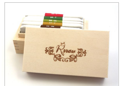
Rrraw 06 - Belle boîte