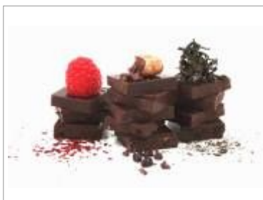
Rrraw 05 - Framboise, Pépite, thé